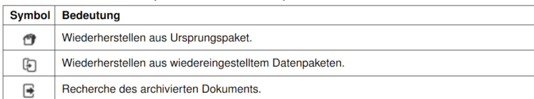
Symbolleiste „Track & Trace Symbole mit Kontextmenü“

Eine nahtlose und fehlerfreie Archivierung ist wichtig für Ihr Unternehmen. Doch was ist, wenn während eines Archivierungsvorganges eine Störung auftritt? Stromausfälle oder ähnliches sind nicht planbar – doch mit Hilfe von „Track & Trace“ sind Sie in der Lage, betroffene, unvollständige oder fehlerhafte Datenpakete immer wieder herzustellen. Somit stellen Sie einfach sicher, dass jedes Paket vollständig und problemlos verarbeitet wird – mehr Sicherheit für Sie.